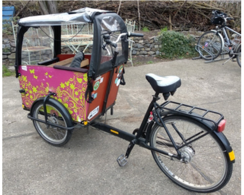
Das Baboe Lastenrad im aktuellen Zustand

Ein freies Lastenrad für Potsdam-Waldstadt